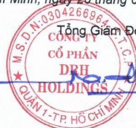
Ngô Đức Sơn