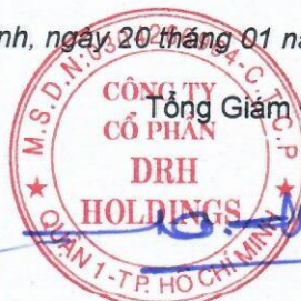
Ngô Đức Sơn